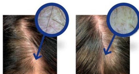
図4. 毛細血管領域にINDIBA®療法。57歳の女性で男性型脱毛症。この患者は、25分間のINDIBA®療法を16回受けた。A) 1回目のINDIBA®セッションの前、上部の領域に密度と量の不足がある。B) 2ヶ月の治療後、最後のINDIBA®セッション。目に見えて太く強い毛髪が観察されます。前頭部のハチの細かい毛の出現が始まっている。

インディバ®療法は効果的で安全であることが証明されており、薄毛や抜け毛に悩むすべての患者さんに確かな違いと非侵襲的で価値の高い非薬物療法を提供することができる。また他のアプローチ（美容、衛生、食事）との相性も良く、補完的な治療として続けることが可能である。