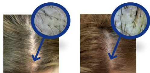
図3. 毛細血管領域にINDIBA®療法を実施。男性型脱毛症の女性。この患者は、25分間のINDIBA®セラピーのセッションを16回受けた。A) 1回目のINDIBA®セッションの前、毛髪は細くて弱く、密度が低い。上部と頭頂部にはほとんど毛髪が見られない。B) 3ヶ月の治療後、最後のINDIBA®セッション。目に見えて太く強い毛髪が観察され、コシとボリュームが増している。