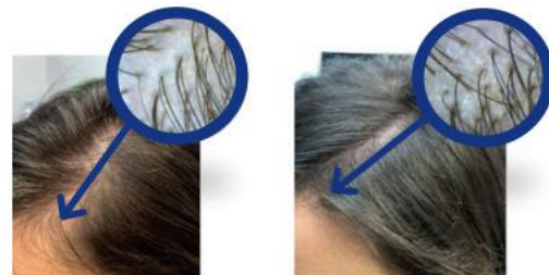
図1. 毛細血管領域でINDIBA®療法を実施。この患者は31歳の女性でINDIBA®セラピーの16セッションを25分間受けた。A) 1回目のINDIBA®セッションの前、毛髪は細く頭頂部と前頭部にはほとんど毛髪が見られない。B) 3ヶ月の治療後、INDIBA®を使った最後のセッション。目に見えて毛髪が濃くなり同じ部位で新しい毛髪の成長が見られる。