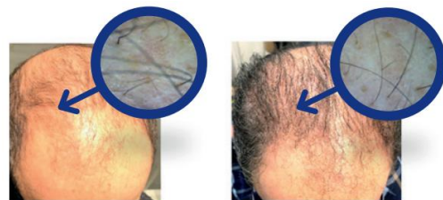
図2. 毛細血管領域でINDIBA®療法を実施。この患者は62歳の男性でアンドロゲン由来の上部ゾーンに脱毛がある。25分のINDIBA®セラピーを16回受けた。A) 最初のINDIBA®セッションの前、前頭部の毛細血管密度が低く、絶対数が少ないことが観察される。B) 3ヶ月の治療後、INDIBA®による最後のセッション。上部に新しい毛髪が現れ、目に見えて強く密になっている。